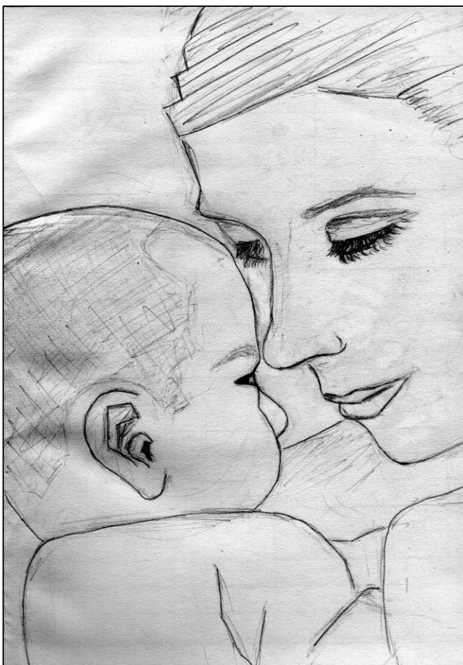
kresba: Marta Spustová